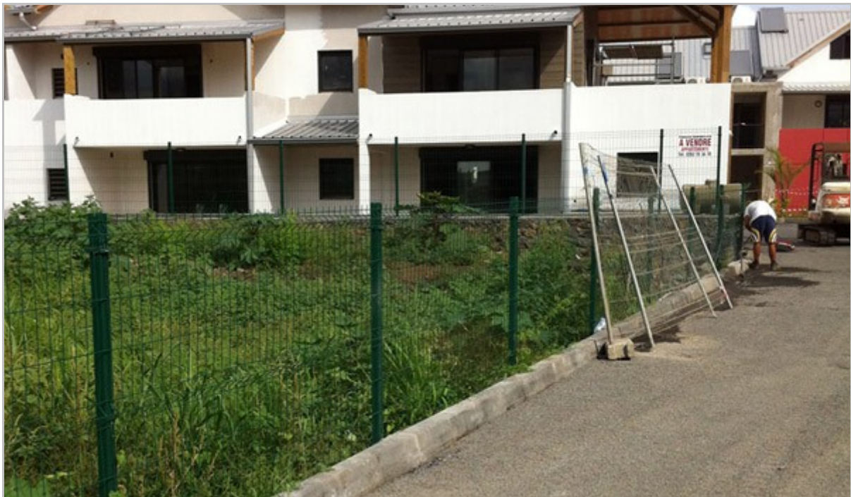
Entrée de la résidence