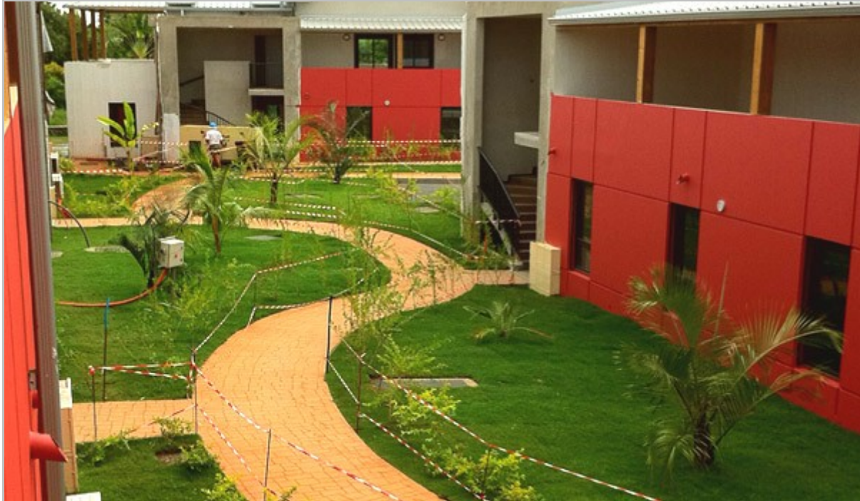
Chemin d'accès à la résidence (qui est très en retrait de la voie principale)