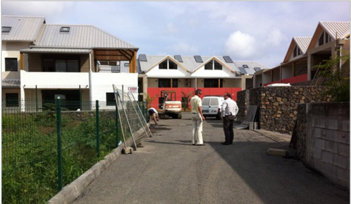
Entrée des parkings en sous-sol qui circulent sous toute la résidence.